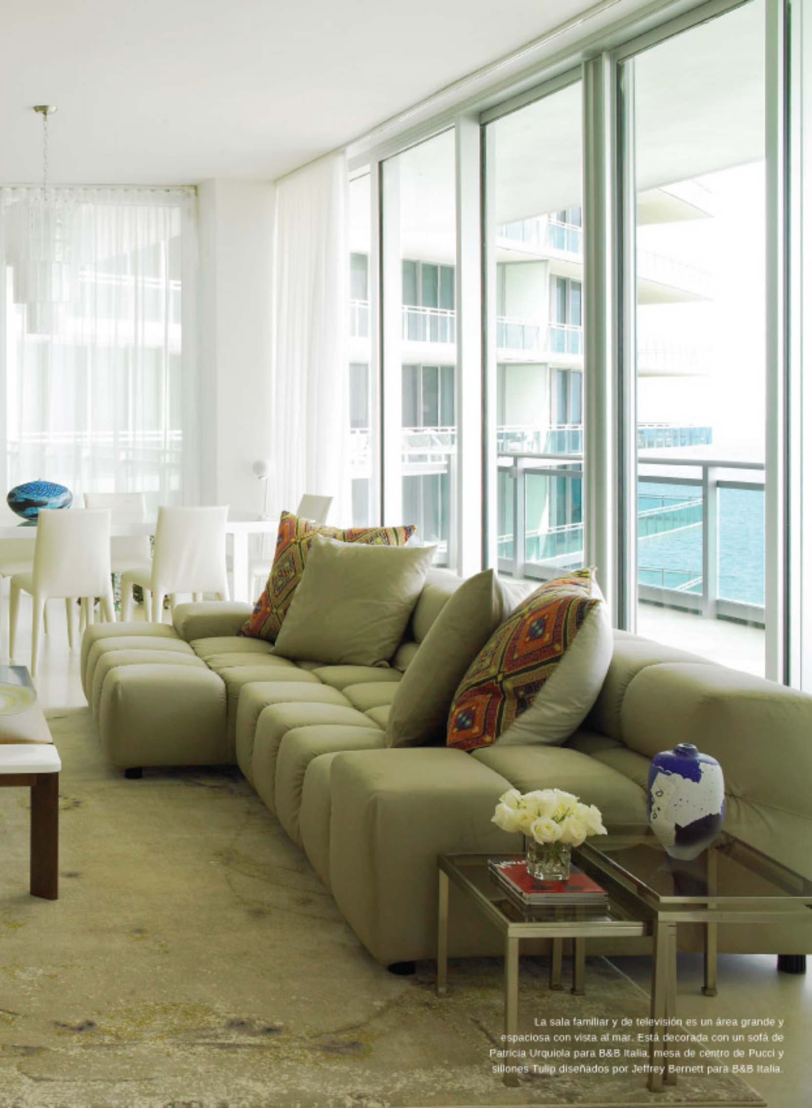
La sala familiar y de televisión es un área grande y espaciosa con vista al mar. Está decorada con un sofá de Patricia Urquiola para B&B Italia, mesa de centro de Pucci y sillones Tulip diseñados por Jeffrey Bennett para B&B Italia.